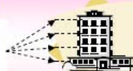
割安に購入した分を入居者様に還元します。

地域電力会社の電気料金に比べ、 5%程度 お安く提供できます。 大人2人・子供2人 家族(従量電灯 40Aの契約)